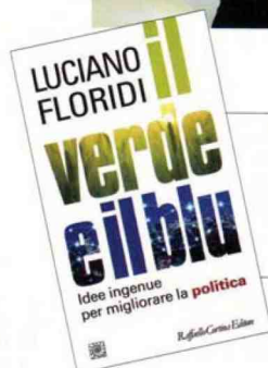
La copertina dell'ultimo libro di Luciano Floridi, Il verde e il blu (Raffaello Cortina), che ha ispirato il titolo del Festival.

Tre giorni di eventi a Milano per riflettere sul mondo che vogliamo. Ci sarà anche iO Donna